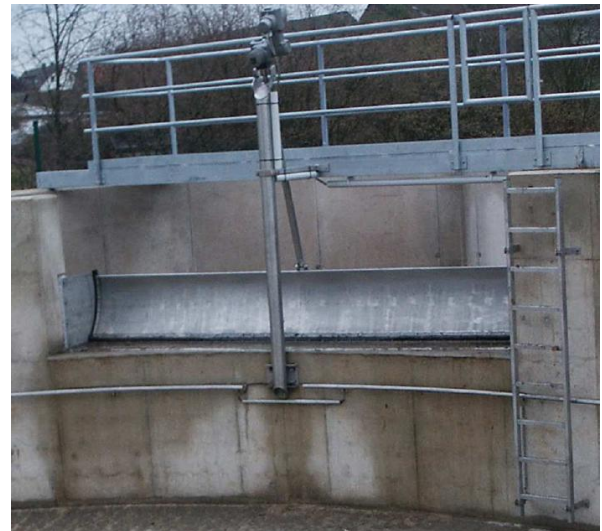
HydroWeir installeret i kanal

HydroWeir kan også anvendes, hvor der er opstuvning nedstrøms overløbskanten. Nedbøjningen af overløbskanten startes ud fra defineret vandstand hhv. opstrøms og nedstrøms overløbskanten.